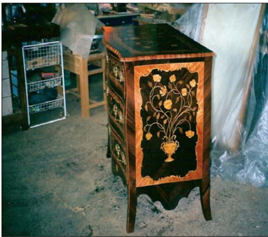
Fig3. Cómida com embutidos florais