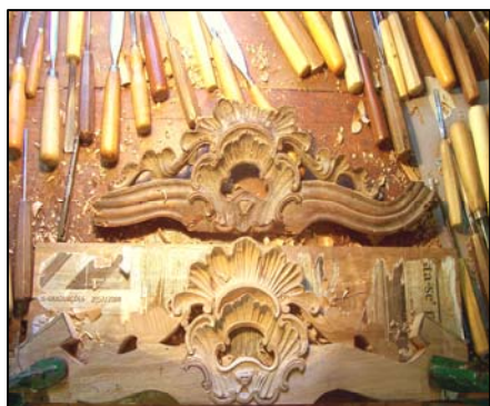
Fig4. cópia de uma peça original